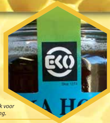
Het EKO-keurmerk voor biologische honing.

7. De Traay is BRC en HACCP hoogste niveau gecertificeerd. Zowel de onafhankelijke BRC norm als het HACCP systeem dienen de voedselveiligheid, kwaliteit en hygiëne van het productieproces te waarborgen.